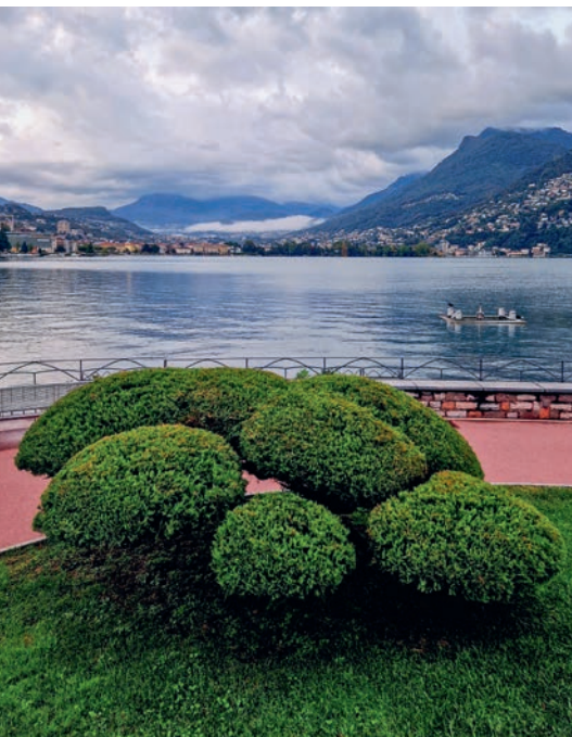
Immer wieder finden sich Elemente aus früheren Gestaltungsphasen, sei es baulicher oder pflanzlicher Herkunft, wie dieses Formgehölz.

mediterranen Touch. All das macht die schmale Uferpromenade schon beinahe zu einem öffentlichen Wohnzimmer, wo sich die Menschen treffen, aufhalten, erholen oder Sport treiben. Dies war von Anfang an ein bewusstes Ziel der Gestaltung, trotz Enge und Raumknappheit.