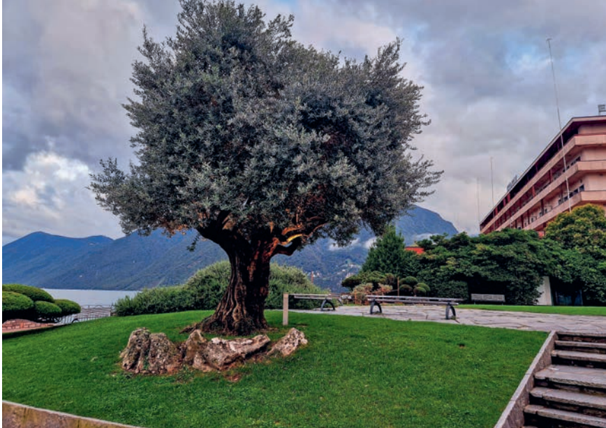
Die Promenade wurde so gestaltet, dass sie einen öffentlichen «Salon» bildet, der mit vielen Sitzgelegenheiten zum Verweilen einlädt. Ausserdem sorgt die Kleinteiligkeit der gesamten Promenade für Abwechslung.